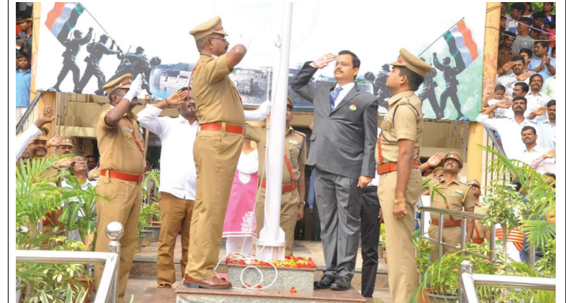
சுதந்திர தினத்தையொட்டி வேலூர் மாவட்டத்தில் கலெக்டர் ராமன் தேசிய கொடி ஏற்றி வைத்து மரியாதை செலுத்திய காட்சி